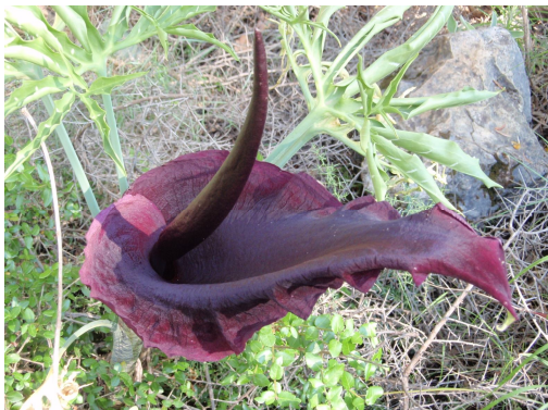
Gudindeblomst ved Visdommens Hule