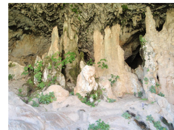
Indgang til Visdommens Hule

Mærk i dit Hjerte om denne rejse kalder på dig - og følg dit Hjertets kald.