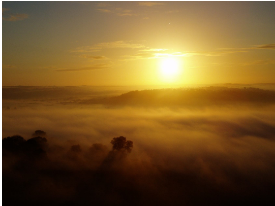
Tågerne over Avalon ved solopgang