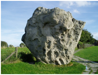
Fortællesten fra Avebury Stencirkel

I får mulighed for at besøge flere kraftsteder på rejsen bl.a. Tor, Avebury Stencirkel, Camelot, Tintagel og Merlin's hule.