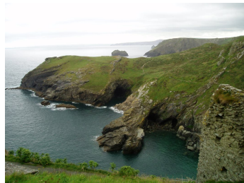
Udsigten fra Tintagel, Cornwall

Vi skal på turen arbejde med krop, sind og ånd(sjæl) – gennem dette vil du få kendskab til din spiritualitet, dine forhindringer og din passion.